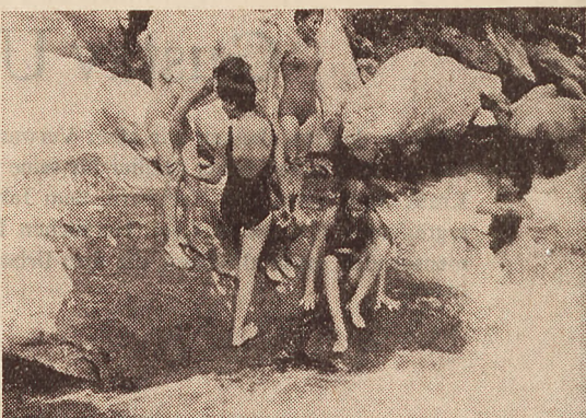
«Far niente» im kühlen Bach.

bob. Vielleicht haben Sie schon gehört oder gelesen vom Jubiläumslager der Pfadfinderinnen im Bleniotal. Von den 7000 Pfadfinderinnen, die am