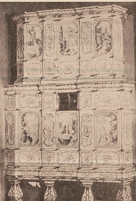
Der kunstvolle Barockofen kann nur je von einer Seite betrachtet werden, da er durch die Stubenwand unterteilt ist.

Der grossdimensionierte Kachelofen mit abgeschragten Ecken, Gesimsen und Lisenen erinnert in seiner architektonischen Gestaltung noch stark an die Zimmeröfen der Renaissance. Dagegen sind die schmückenden Malereien barock. Die grossen Bildkacheln sind durchgehend dem Thema Was-