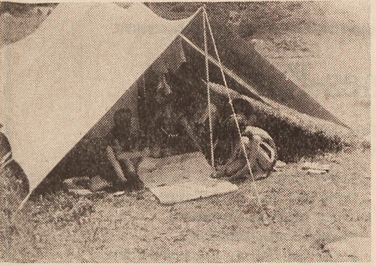
Ein Plakat ist am Entstehen.