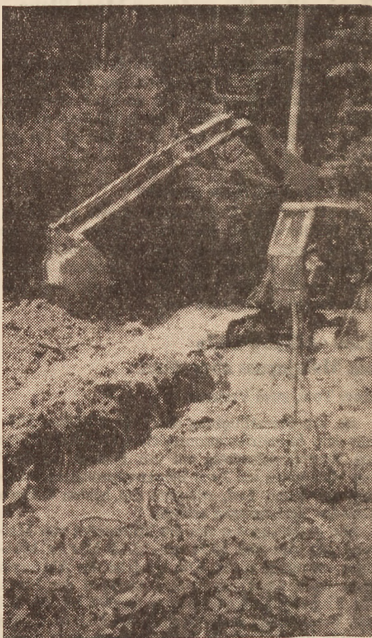
Der erste Graben für die Waldhütte.

In den letzten Monaten wurden nun die Arbeiten vergeben. Es darf hier mit grossem Stolz vermerkt werden, dass sich viele Ortsbürger, aber auch «zugewandte» Einwohner, zu äusserst günstigen Bedingungen für Arbeiten zur Verfügung